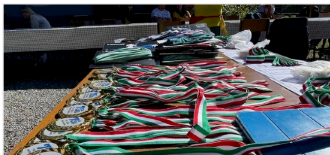
Il tavolo delle premiazioni con le medaglie del Panathlon