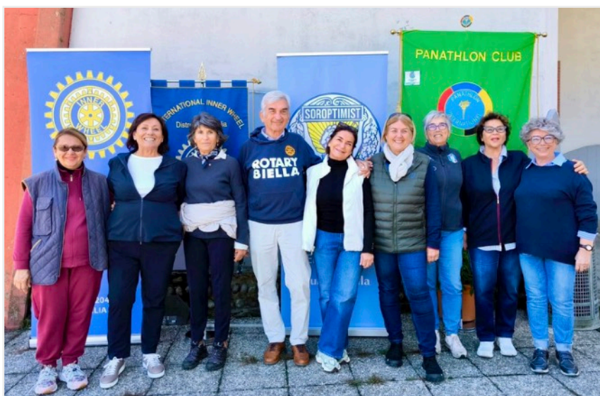
I rappresentanti dei Club di Servizio che sostengono "Sportivamente Insieme"