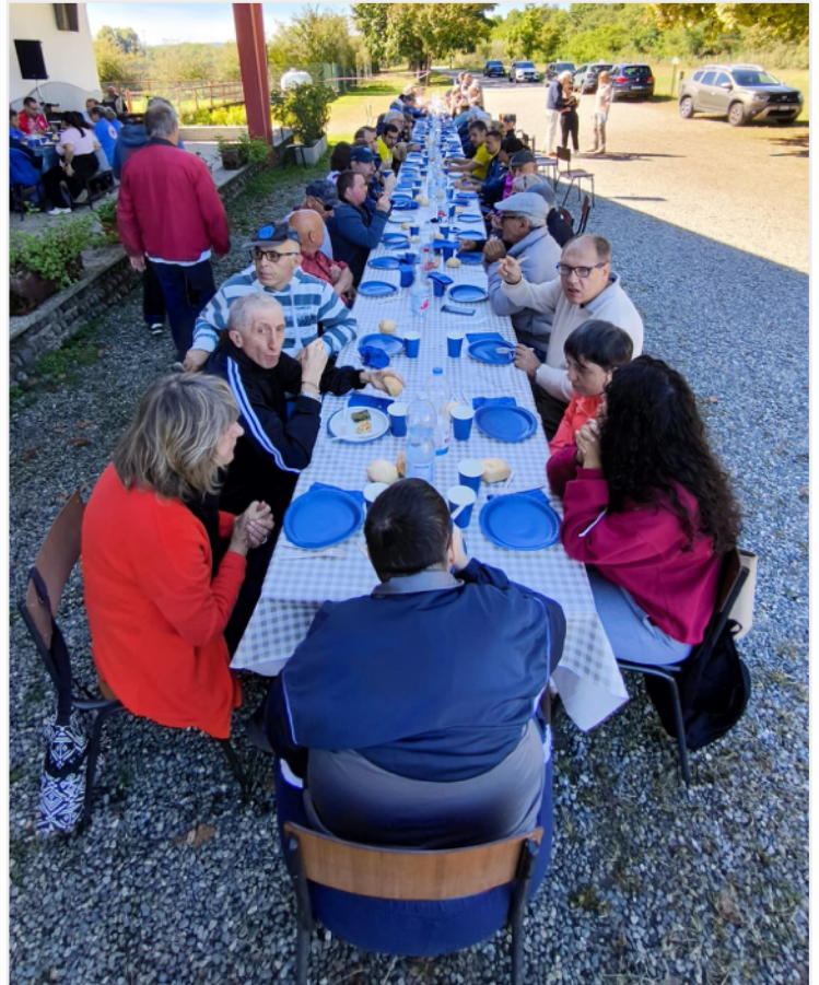
Atleti, tecnici e volontari uniti in allegria nel momento conviviale