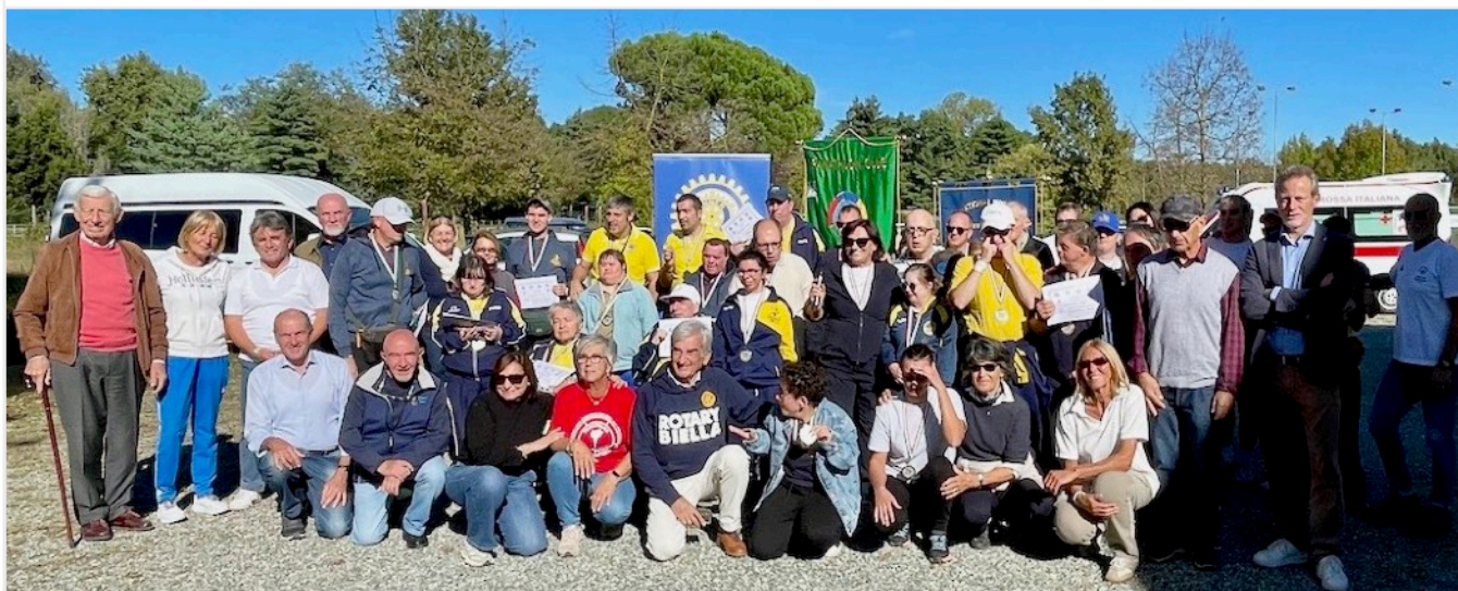
Partecipanti, autorità e volontari al termine della giornata

«Sportivamente insieme...» l'appuntamento dedicato alle ragazze e ai ragazzi con disabilità è stata ancora una volta una festa.