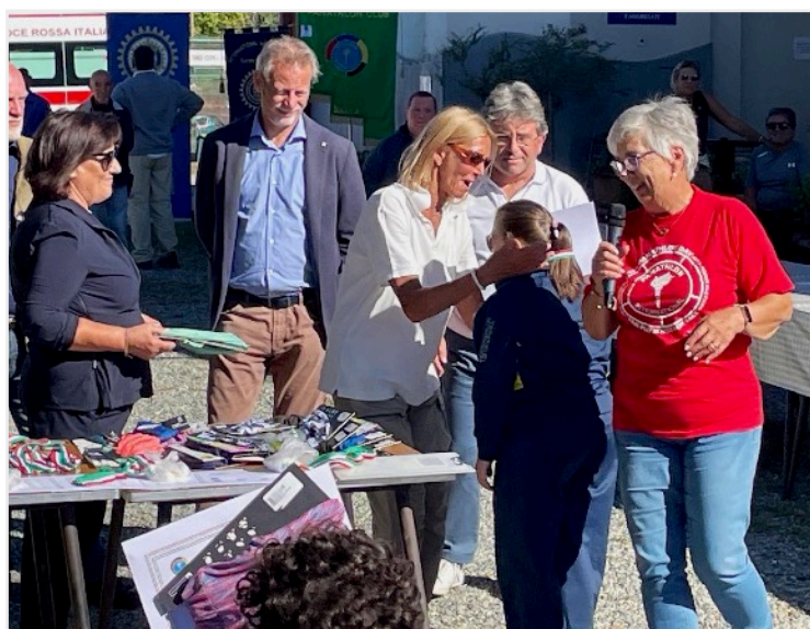
Un momento della premiazione degli atleti

Grazie a tutti per aver reso possibile, ancora una volta, questa splendida giornata di sport e amicizia.