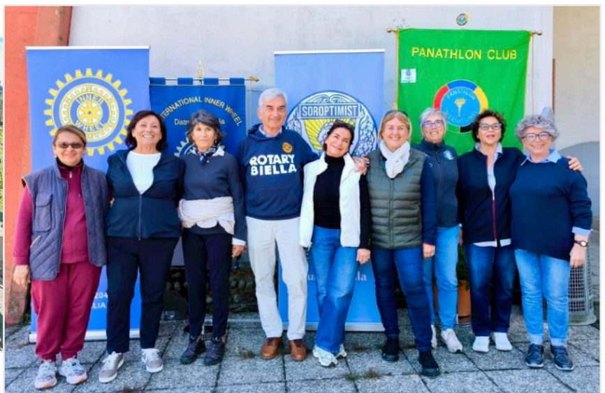
I rappresentanti dei Club di Servizio che sostengono "Sportivamente Insieme"