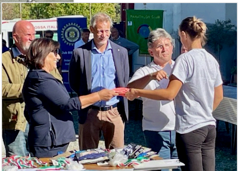
La consegna delle medaglie è un momento particolarmente emozionante