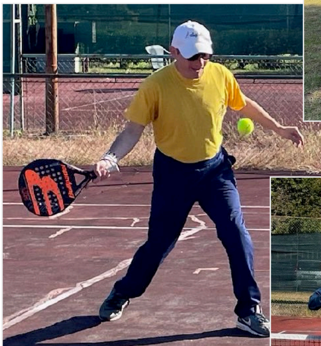
Gli atleti si sono dimostrati appassionati e bravi giocatori di padel