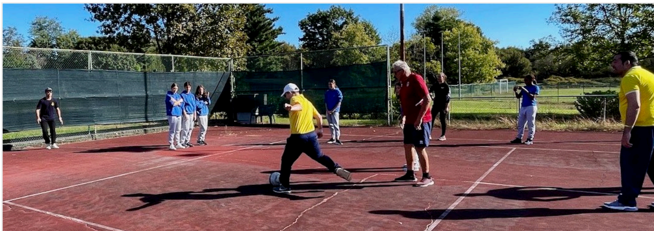
Tiro di rigore

Liceo Sportivo dell'Isti «Q. Sella» di Biella. Terminati i giochi, un momento conviviale fra tutti i presenti, un po' di canzoni lanciate verso lo splendido cielo tornato azzurro dopo le piogge dei giorni precedenti la manifestazione e qualche ballo, l'attesissimo momento