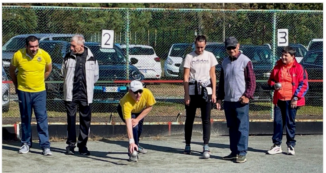
Il gioco delle bocce richiede precisione e concentrazione: i componenti di una squadra alla prova

questo aspetto è sempre presente: i ragazzi, atleti e non, hanno l'opportunità di cimentarsi in discipline diverse da quelle abituali, scoprendo nuove passioni e vivendo un'esperienza arricchente, dal punto di vista fisico, cognitivo e sociale.