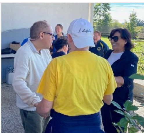
Dopo le premiazioni si balla tutti insieme